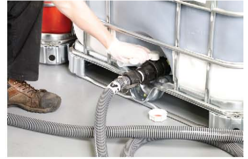
12) 打开 CAT 和 ISO 料桶上的球形阀门开关(如图)。