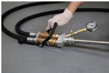
20) 关闭手动操作杆上的主开关。