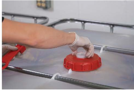
11) 将料管与料桶底部的出料口连接，并打开 CAT 料桶上的白色盖子(如图)。