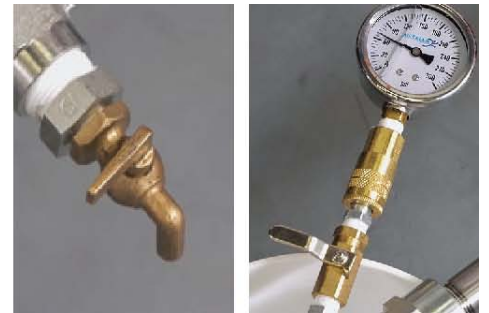
18) 确保排水阀及仪表阀是关闭状态。