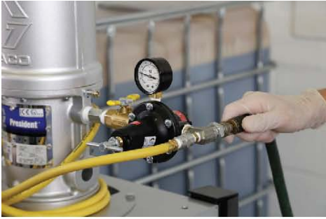
10) 连接气管到气泵的接头处。