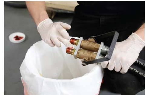
15) 安装前在接头部位涂抹适量润滑油。