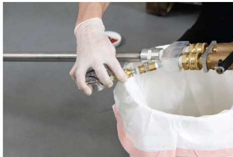
17) 然后将压力表安装到气杆上。