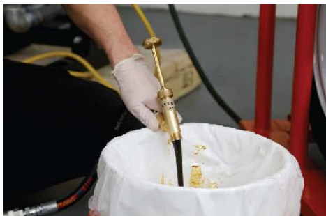
19) 将初次排出的填充物放进垃圾桶内，使管件内部不存在任何清洗液等异物。