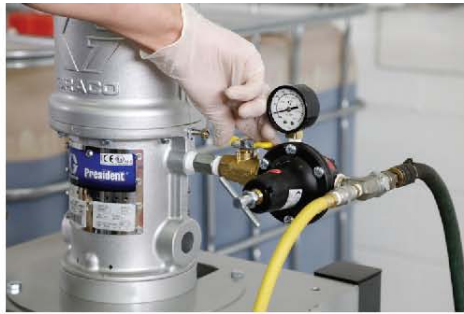
14) 打开给气泵供气的黄色通气开关。