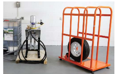
21) 将准备好的轮胎放置于安全笼内，准备进行填充操作。